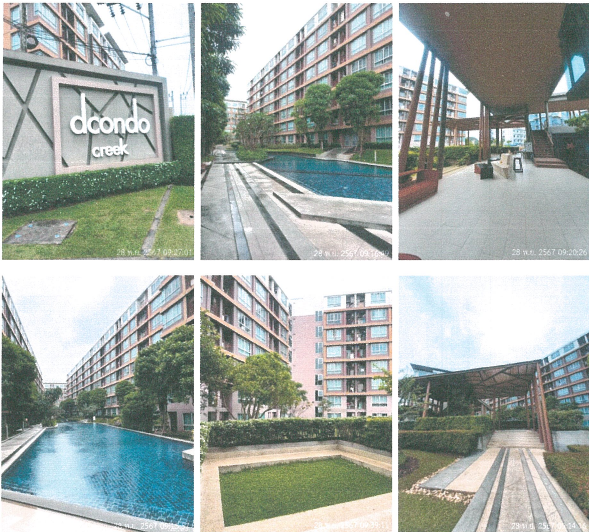
รูปภาพที่ 1.4 การใช้พื้นที่อาคาร